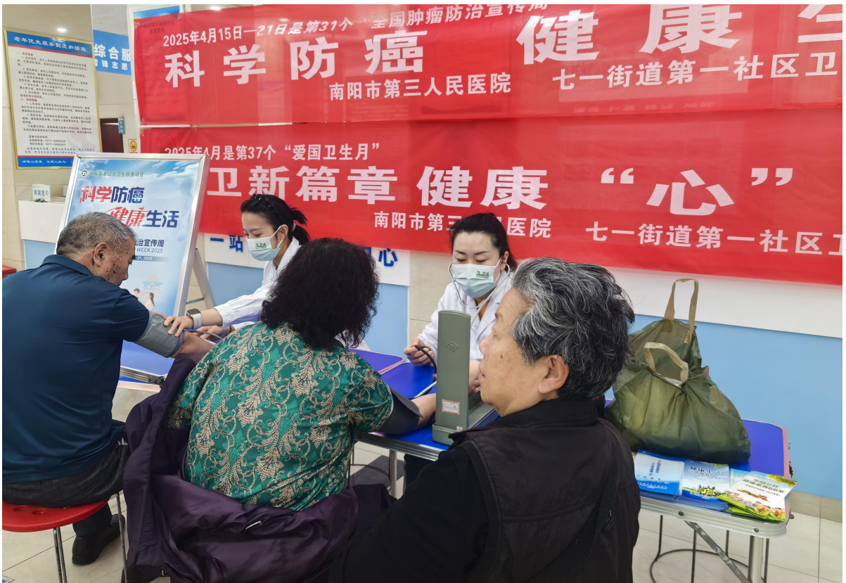
HUAWEI Pocket 2

XIMAGE 27mm F1.6 1/100s ISO200 2025/04/21 09:42