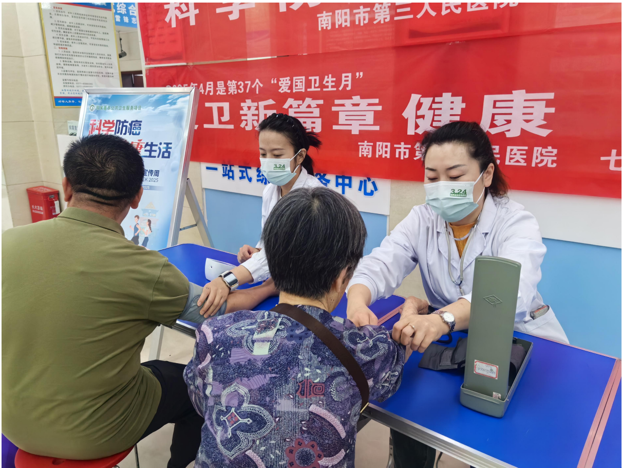
HUAWEI Pocket 2

X.MAGE 27mm F1.6 1/100s ISO250 2025/04/21 09:29